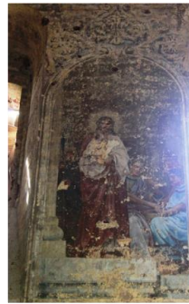
Церковь Троицы Живоначальной (1763г)