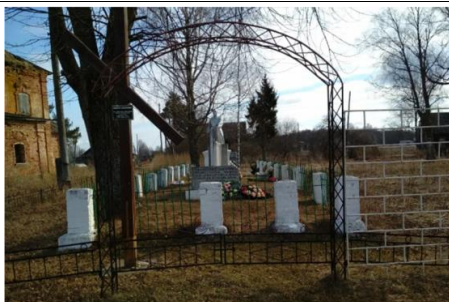
Воинское кладбище (на котором похоронены воины освобождавшие д. Луги с 13-14 января 1942 года)