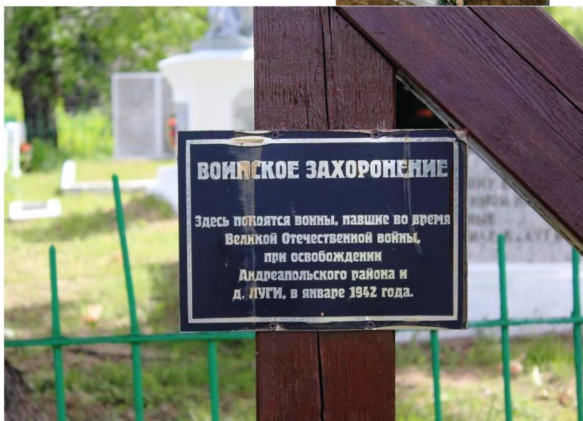
Братская могила советских воинов, павших в годы Великой Отечественной войны